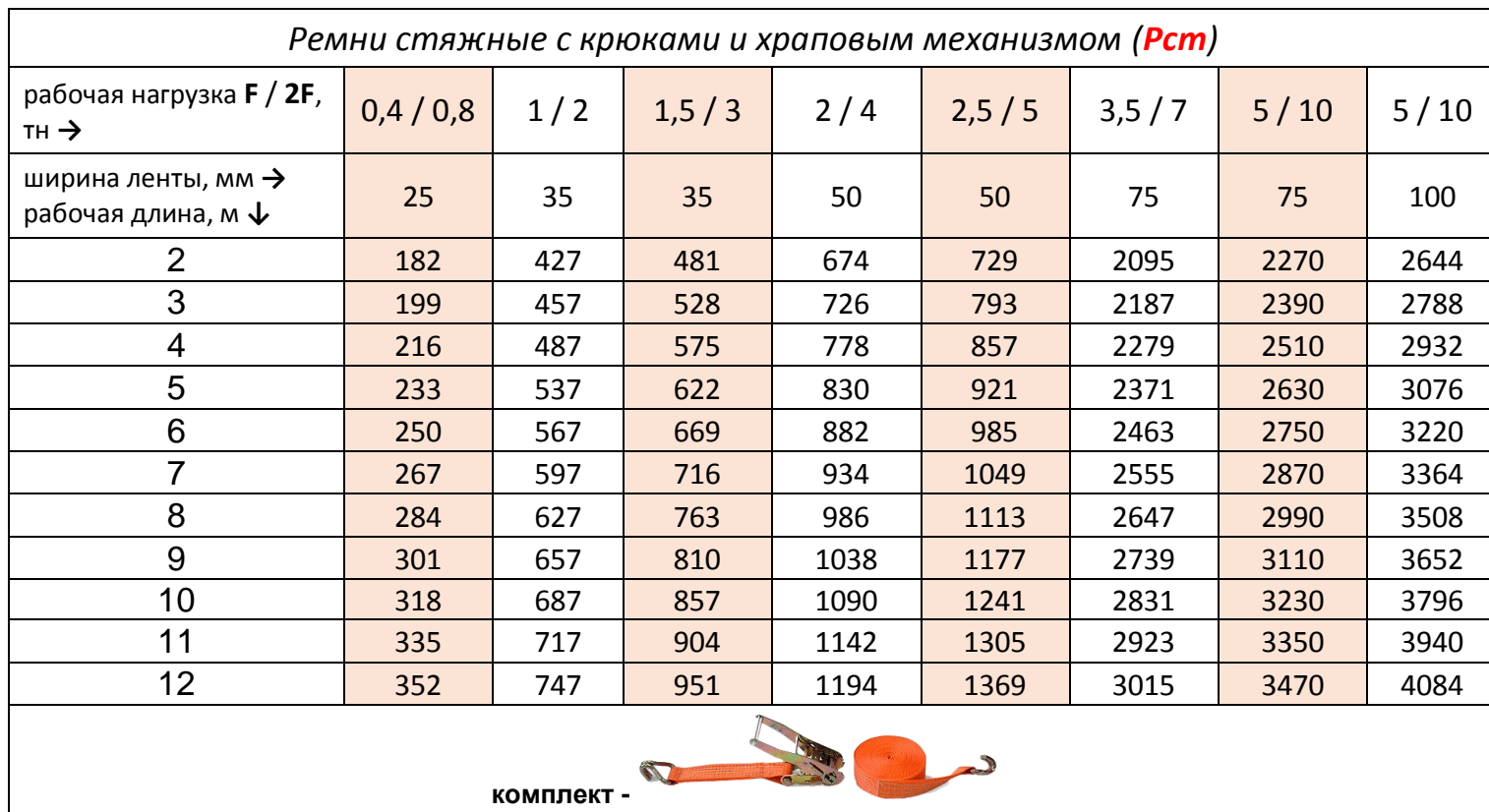
Ремни стяжные с крюками и храповым механизмом (Рст)

Пример маркировки стяжного ремня: ремень стяжной с крюками 1,5 / 3,0 тн , лента 35 мм допустимая рабочая нагрузка ремня 1,5 тн (F) по прямой, при обхвате груза 3,0 тн (2F)